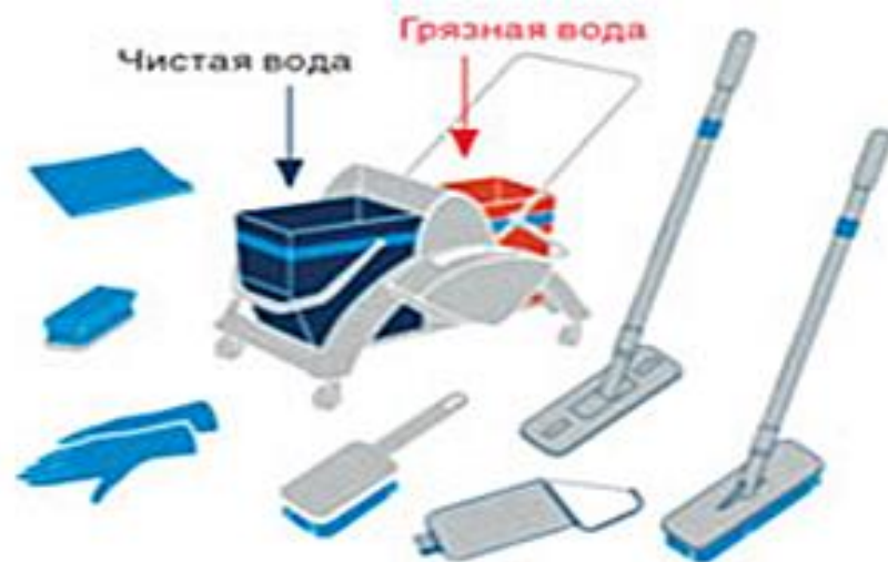
СИНИЙ — помещения для посетителей, гостевая зона