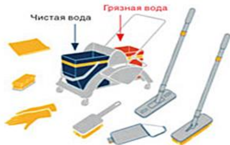
ЖЕЛТЫЙ — подсобные помещения