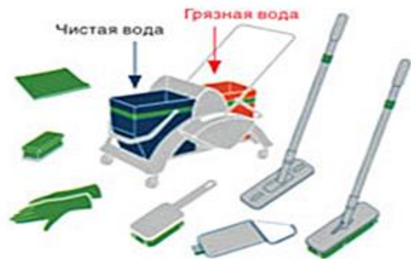
ЗЕЛЕНый — производственные цеха