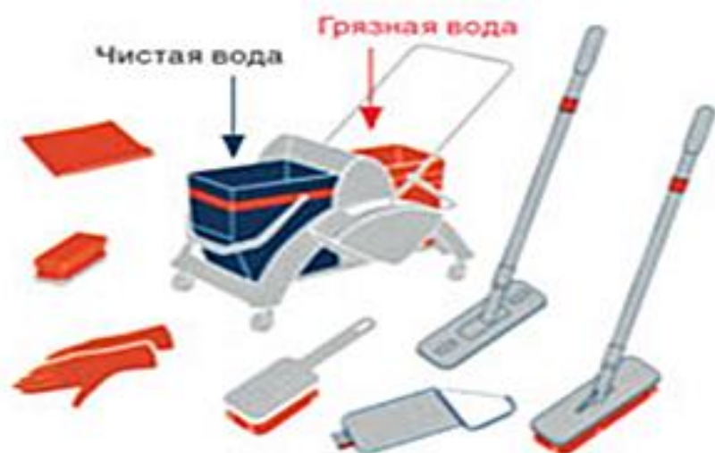
КРАСНЫЙ — санузел